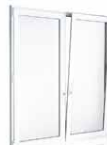
Porta e Janela Oscilo Batente