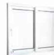
Janela de Correr