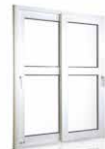
Janela Porta de Correr