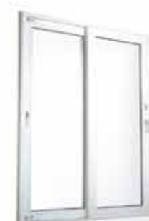
Porta de Correr